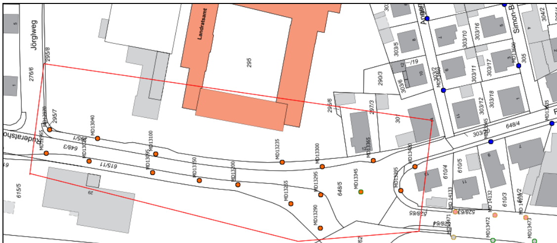
Abbildung 1-3: Plangebiet